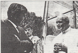
Lubbers with the pope in The Hague: 'Good Catholics think it is essential to speak out'