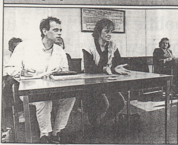
● Een van de moeders met een woordvoerder van een andere, maar soortgelijke commune, in de Haagse rechtbank.